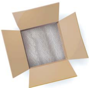
1. Odpowiedni wypełniacz zmniejsza ryzyko uszkodzenia towaru w środku

! Prawidłowo wypełniona i naklejona etykieta transportowa ma bezpośredni wpływ na terminowe i skuteczne doręczenie Twojej przesyłki.