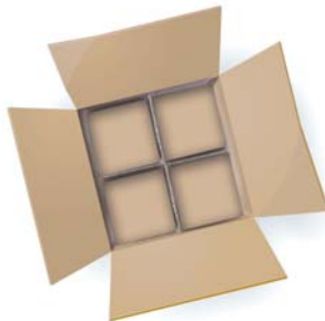
2. Pojedyncze elementy oddziel przegródkami